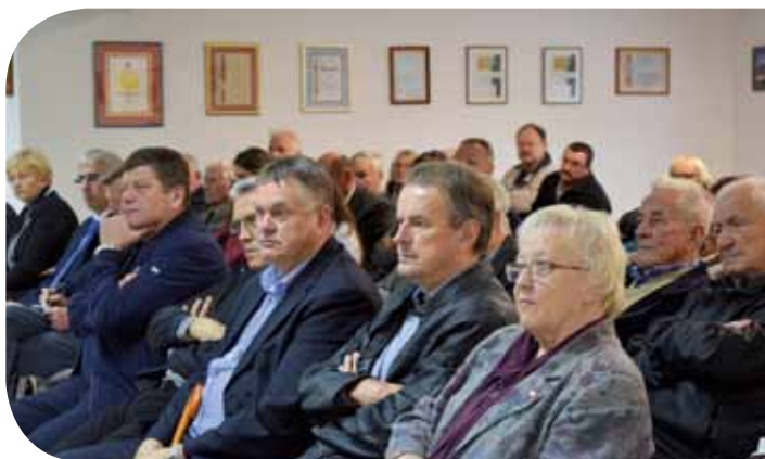
Okrogle mize v Črnomlju se se udeležili tudi člani naše poslanske skupine.