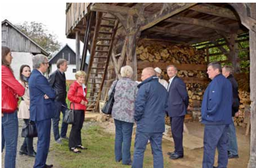
V belokrajnskem Rimu so nam pokazali kako iz bilke nastane lan.